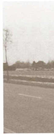
Van op de Grote Steenweg rijdend richting St-Truiden zien we voor de kruising de toekomstig bedrijvenzone rechts liggen.

In 2005 breidt de gemeente de loods aan het stationsplein in Geetbets uit (133.000 euro), daar de huidige loods veel te klein is om het sterk aangroeiende machinepark te herbergen. Voorts wordt het verkeerscirculatieplan verder uitgevoerd (150.000 euro). Wegen en infrastructuur krijgen een buitengewoon onderhoud (200.000 euro). Ook worden de eerste stappen gezet voor de verbetering van de fietspaden en de herinrichting van het dorpsplein in Rummen (25000 euro). Het project Krommaesbeek (149.000 euro) en het erosiebestrijdingsproject (104.000 euro) gaan eveneens van start. De kerkfabriek van Onze-Lieve-Vrouw van Vrede Hogen krijgt een doorgeeflening van 8.520 euro. Om het probleem van zonevreemde woningen aan te pakken wil de gemeente een beroep doen op een uitvoeringsplan zonevreemde woningen. Voorts wil de