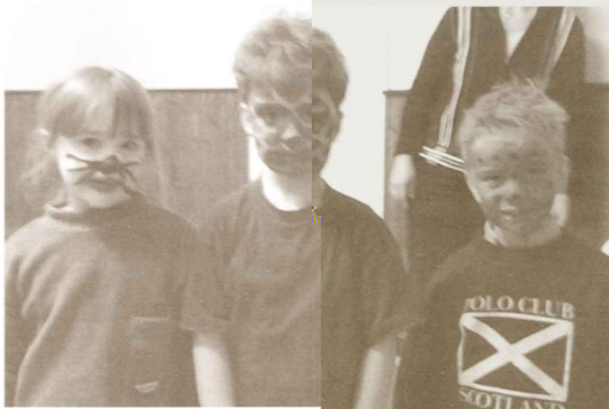
Drie van de kleine musicalsterren met een prachtig geveerd gezichtje

De 75 kleuters en 27 leerlingen van het eerste leerjaar van de vrije basisschool Geetbets lieten zich door Valentijn inspireren voor het grootoudersfeest. Zij brachten dan ook prompt de musical "Mag ik een kusje van jou" in het parochiecentrum van Geetbets. Nooit te jong voor de liefde dachten de guitige rakkers. Succes en belangstelling waren zo groot dat extra voorstellingen ingelast moesten worden.