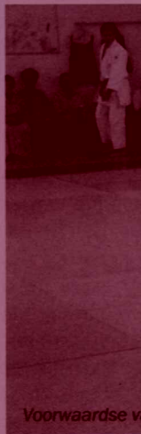
Voorwaardse veld voor de gevechten!