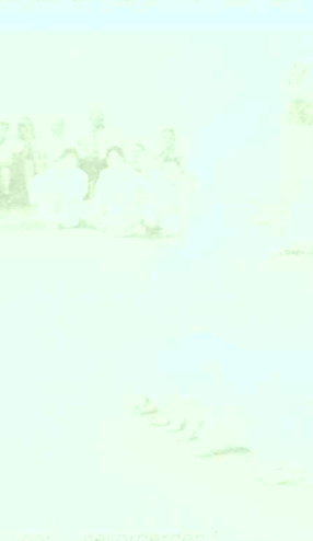
Voorwaardse veld voor de gevechten!