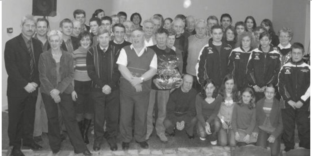
Vrijdag 17 februari werden de sportkampioenen en verdienstelijke personen 2005 gehuldigd door de sportraad, de cultuurraad en het gemeentebestuur. Op pagina 3 vind je een overzicht van de laureaten.