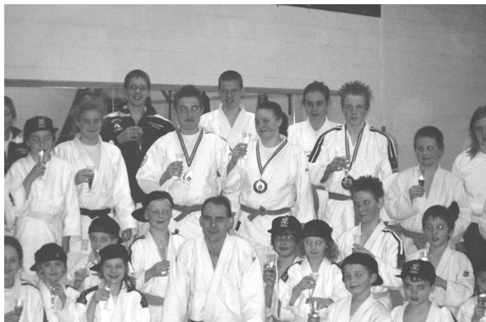
Een mooie verzameling Betserse judokampioenen met hun coach

Je kunt ook terecht op onze website www.ocmwgeetbets.be of op de volgende websites voor nog meer info: www.energiesparen.be , www.fiscus.fgov.be , www.pbe.be/REG/REG.html , www.vlaamsbrabant.be/levenenwonen/wonen.be , www.wonen.vlaanderen.be/static/Pages/tegemootkomingen.html en www.premiezoeker.be .