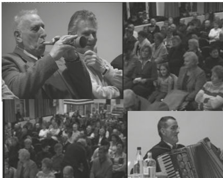
Winterse Vertelavond 2006