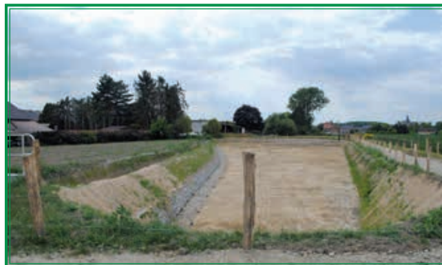
Overstromingszone op de Asbeek tussen Kraaistraat en Persoonstraat