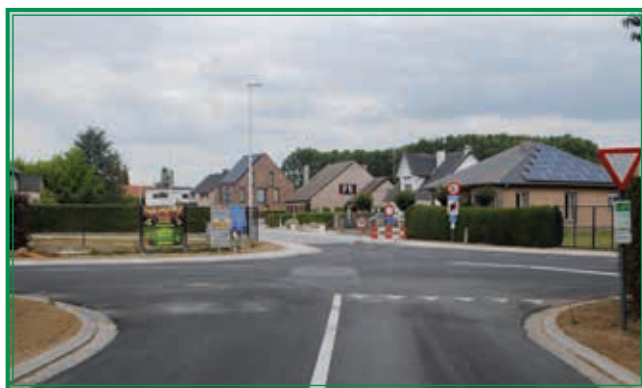
Kruispunt Kasteellaan-Warandeweg- Ketelstraat-Biesemstraat